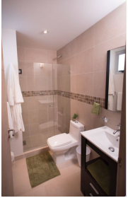
Baños con cubierta ceramica y cristal templado Bathroom with ceramic cover and tempered glass