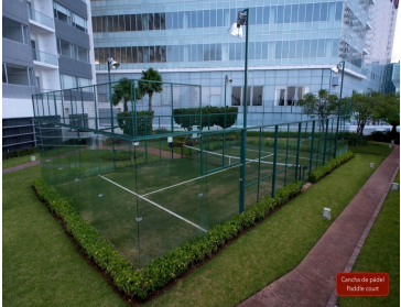
Centro de pádel Pádel court