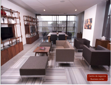
Centro de negocios Business center