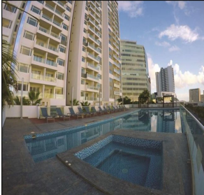
Alberca con jacuzzi Swimming pool & jacuzzi