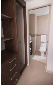
Recamara principal con closet y baño privado Main bedroom with closet and private bathroom