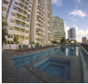
Alberca con jacuzzi Swimming pool & jacuzzi