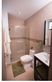
Baños con cubierta cerámica y cristal templado Bathroom with ceramic cover and tempered glass