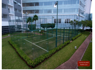
Centro de pádel Pádel court