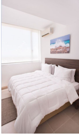
Ventanas amplias, recamaras iluminadas Wide windows in bedrooms, natural light