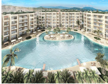
El Anso Cabo San Lucas The arch