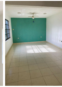
Amplias ventanas con entrada de luz natural Wide windows with natural light