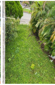
Jardin con acceso a la calle Garden with access to the street