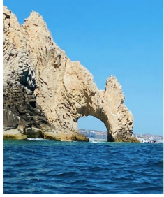
El Arco Cabo San Lucas The arch