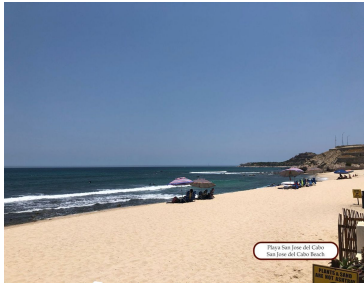
Playa San Juan del Cabo San Juan del Cabo, Baja California Sur