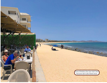
Los Toldos San Juan del Cabo San Juan del Cabo, Baja California Sur