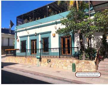
Hotel Hacienda San Juan del Cabo Hacienda San Juan del Cabo