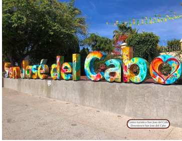
Centro Histórico San Juan del Cabo Hacienda San Juan del Cabo