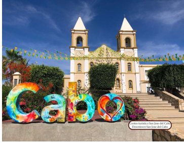
Centro Histórico San Juan del Cabo Hacienda San Juan del Cabo