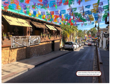
Hotel Hacienda San Juan del Cabo Hacienda San Juan del Cabo