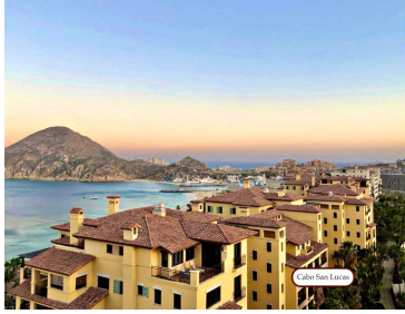
Cabo San Lucas