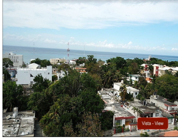
Vista - View