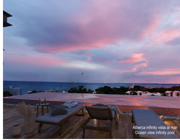
Aberca infinity vista al mar Ocean view infinity pool