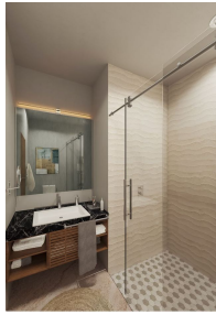
Baño con vidrio templado Bathroom with tempered glass