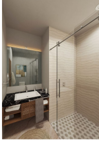
Baño con vidrio templado Bathroom with tempered glass