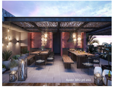
Asador BBO grill area