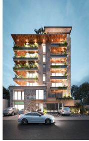
Fachada de noche Facade by night