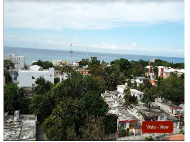
Vista - View