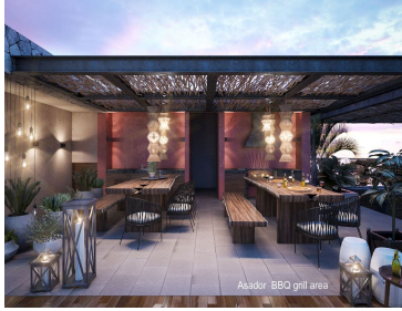
Asador BBQ grill area