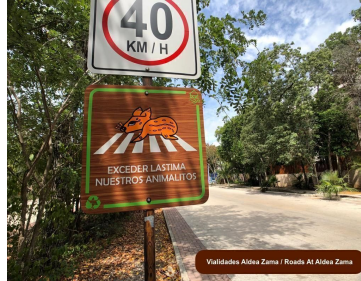
Validades Aldea Zama / Roads At Aldea Zama