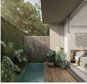
Casita con alberca privada Private pool casita