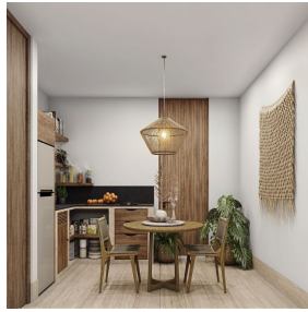
Cocina con cubierta de granito y acabados en maderas Kitchen with granite countertop and wood finishes