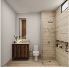
Baños con cubierta de mármol Bathrooms with marble finishes