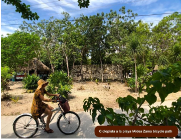
Ciclista a la playa | Aldea Zama bicycle path