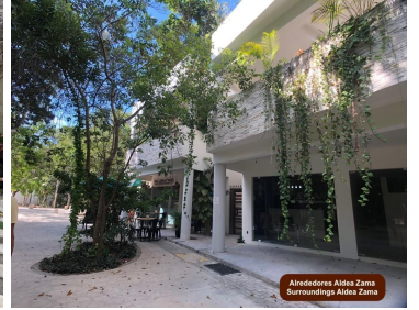
Alrededores Aldea Zama Surroundings Aldea Zama