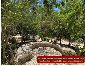
Bancos de piedra rodeados de áreas verdes. Aldea Zama Rock benches surrounded by green areas. Aldea Zama