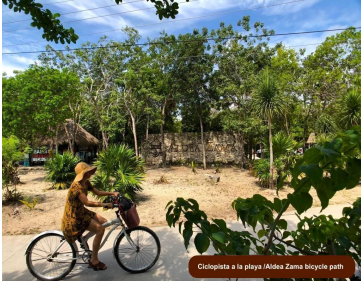
Ciclista a la playa | Aldea Zama bicycle path