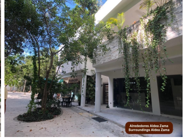
Alrededores Aldea Zama Surroundings Aldea Zama