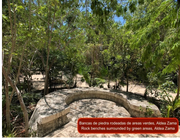
Bancos de piedra rodeados de áreas verdes. Aldea Zama Rock benches surrounded by green areas. Aldea Zama