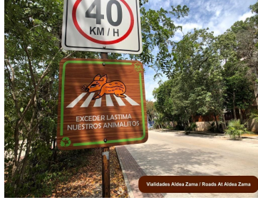
Validades Aldea Zama / Roads At Aldea Zama