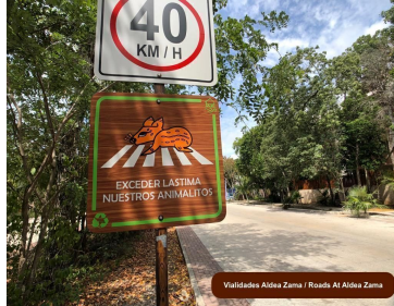
Validades Aldea Zama / Roads At Aldea Zama