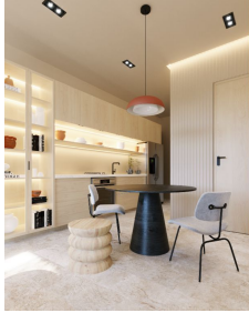
Iluminación de diseño Design lighting