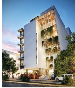
Fachada al atardecer Facade by evening