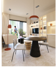
Ventanas de piso a techo Floor to ceiling windows