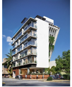
Diseño moderno Modern design