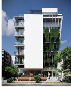
Jardines colgantes Hanging gardens