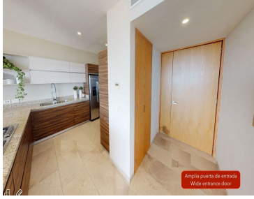
Amplia puerta de entrada Wide entrance door