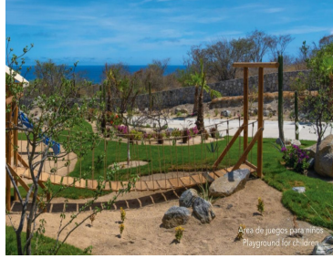
Área de juegos para niños Playground for children