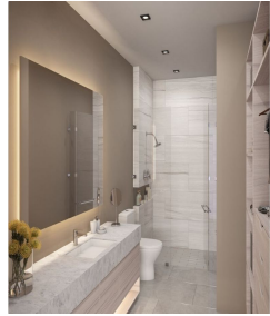
Baño moderno Modern style bathroom