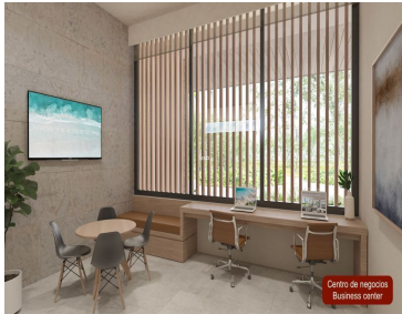
Centro de negocios Business center