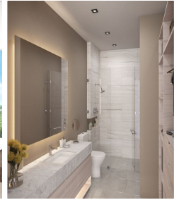
Baño moderno Modern style bathroom