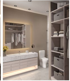
Baño principal Main bathroom