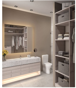
Baño principal Main bathroom