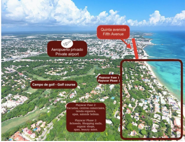
Quinta avenida Fifth Avenue Aeropuerto privado Private airport Campo de golf - Golf course Playacar Fase 1 Playacar Phase 1 Playacar Fase 2 Playacar Phase 2 Playacar Fase 3 Playacar Phase 3 Playacar Fase 4 Playacar Phase 4 Playacar Fase 5 Playacar Phase 5 Playacar Fase 6 Playacar Phase 6 Playacar Fase 7 Playacar Phase 7 Playacar Fase 8 Playacar Phase 8 Playacar Fase 9 Playacar Phase 9 Playacar Fase 10 Playacar Phase 10