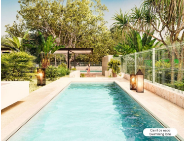
Card de acceso Swimming lane