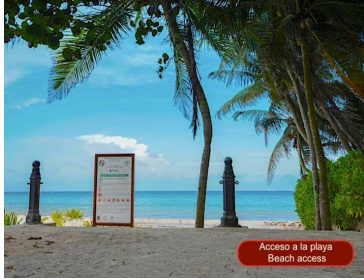
Acceso a la playa Beach access