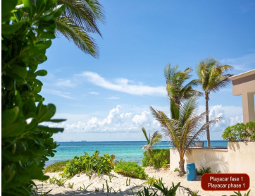
Playacar fase 1 Playacar phase 1