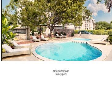
Aberca familiar Family pool