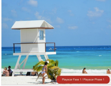
Playacar Fase 1 / Playacar Phase 1