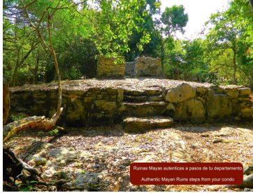
Restos Mayas auténticos a pasos de tu departamento Authentic Mayan Ruins steps from your condo