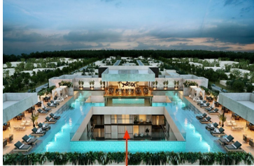
Roof top con vista interior a la Ceiba Roof top with interior view to the Ceiba tree