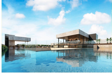
Alberca infinity pool bar con vista panorámica Infinity pool & bar with panoramic view