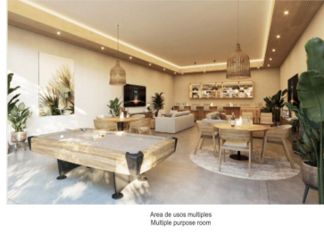
Áreas de usos múltiples Multiple purpose room