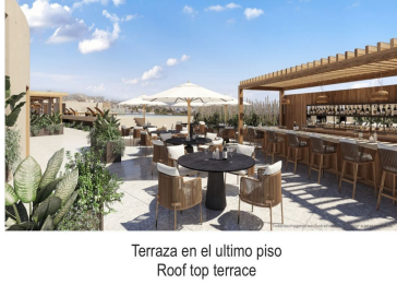
Terraza en el último piso Roof top terrace