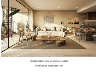
Terraza privada en planta alta en algunas unidades Roof top private terrace in some units