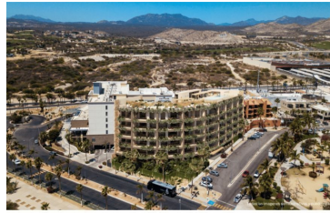
Vista a la montaña Mountain view