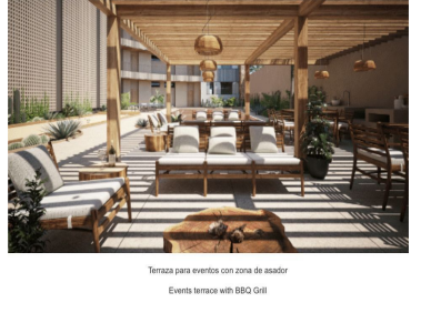
Terraza para eventos con zona de acobar Events terrace with BBQ Grill