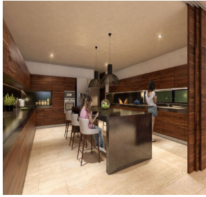
Cocina Isla central Kitchen Central island