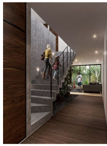
Entrada y pasillo Entrance and hall