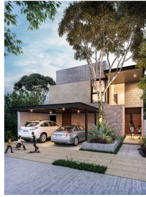
Fachada Luzes arquitectónicas Facade Architectural lights