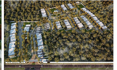
Vista Aérea del residencial Gated community aerial view