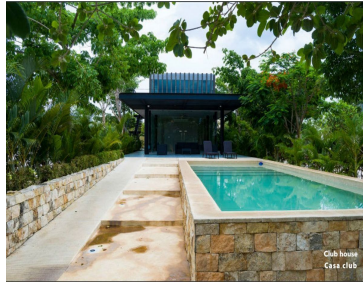
Club house Cott club