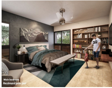
Main bedroom Recámara principal