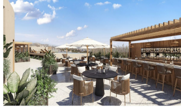
Terraza en el último piso Roof top terrace