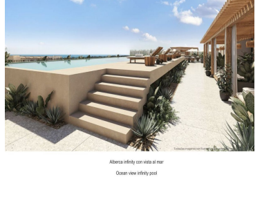
Alberca infinity con vista al mar Ocean view infinity pool