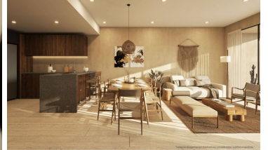
Diseño abierto Open design