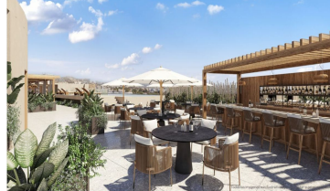
Terraza en el último piso Roof top terrace