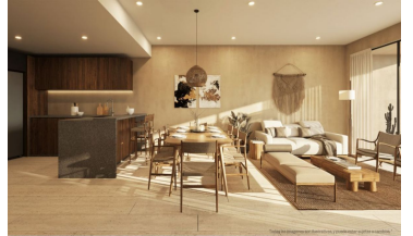
Diseño abierto Open design