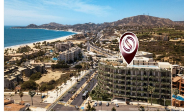
A 300 metros del mar 300 meters from the beach