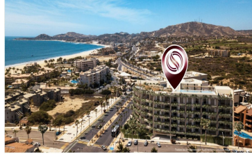
A 300 metros del mar 300 meters from the beach