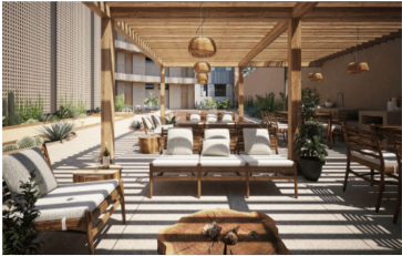
Terraza para eventos con zona de asador Events terrace with BBQ Grill