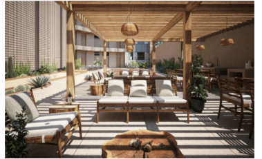
Terraza para eventos con zona de asador Events terrace with BBQ Grill