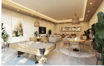
Área de usos múltiples Multiple purpose room