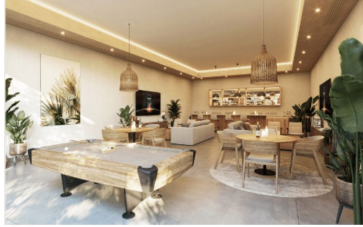
Área de usos múltiples Multiple purpose room