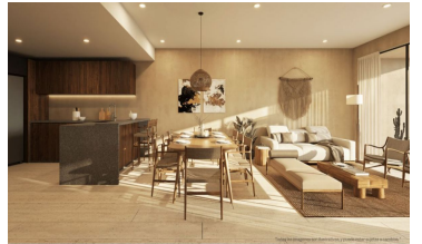
Diseño abierto Open design