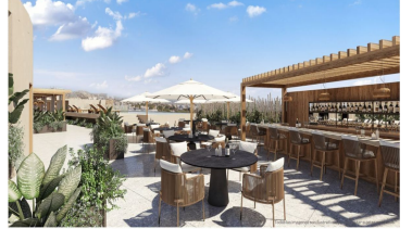
Terraza en el último piso Roof top terrace