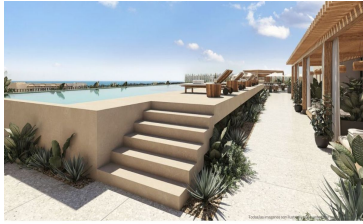
Alberca infinity con vista al mar Ocean view infinity pool