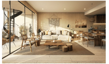
Terraza privada en planta alta en algunas unidades Roof top private terrace in some units