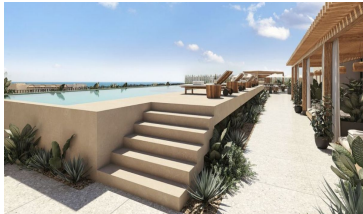
Alberca infinity con vista al mar Ocean view infinity pool