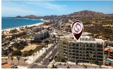
A 300 metros del mar 300 meters from the beach