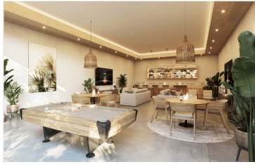
Área de usos múltiples Multiple purpose room