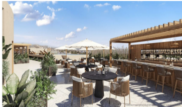
Terraza en el último piso Roof top terrace