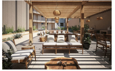
Terraza para eventos con zona de asador Events terrace with BBQ Grill