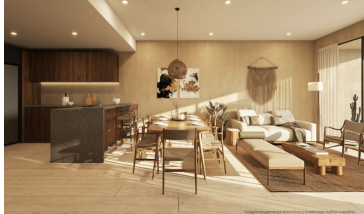
Diseño abierto Open design