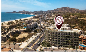
A 300 metros del mar 300 meters from the beach