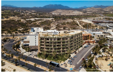
Vista a la montaña Mountain view