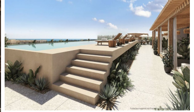
Álbera infinity con vista al mar Ocean view infinity pool