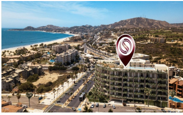
A 300 metros del mar 300 meters from the beach