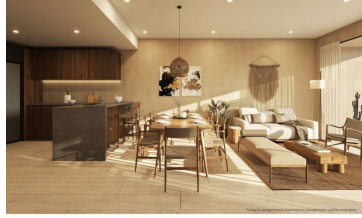
Diseño abierto Open design