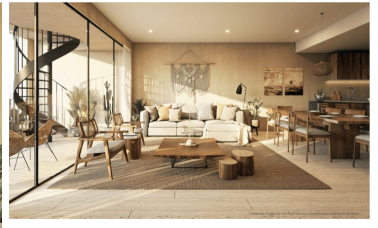
Terraza privada en planta alta en algunas unidades Roof top private terrace in some units