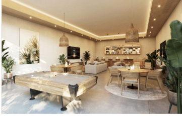
Área de usos múltiples Multiple purpose room