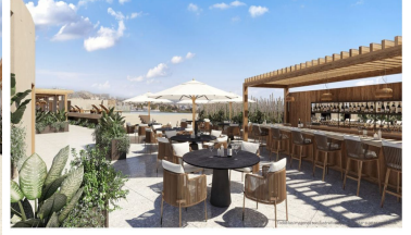
Terraza en el último piso Roof top terrace