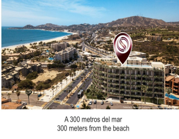
A 300 metros del mar 300 meters from the beach