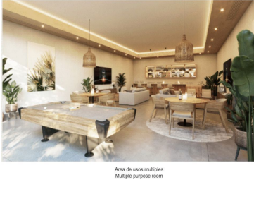
Área de usos múltiples Multiple purpose room