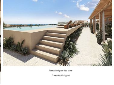
Alberca infinity con vista al mar Ocean view infinity pool