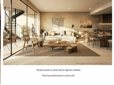
Terraza privada en planta alta en algunas unidades Roof top private terrace in some units