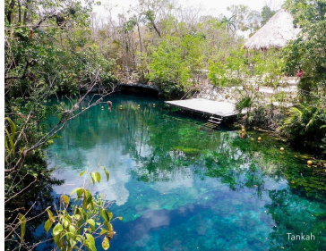
Vista aerea - Aerial view