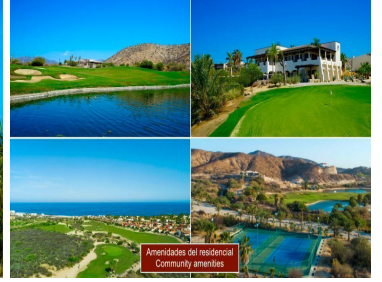
Campo de golf con vista al mar Ocean view golf course