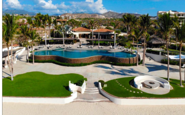
Club de playa Beach club