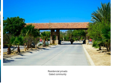
Residencial privado Gated community