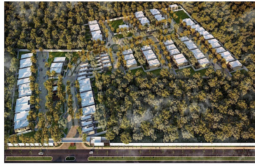
Vista Aerea del residencial Gated community aerial view