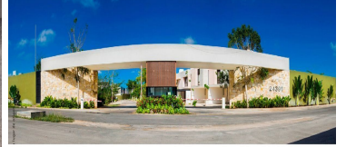
Entrada principal Acceso controlado Barda perimetral Main entrance Controlled access Perimeter fence