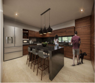
Cocina Isla Central Kitchen with island