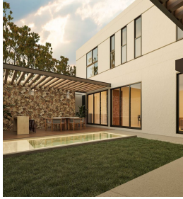
Terraza amplia que se conecta con la sala Wide terrace that connects to the living room