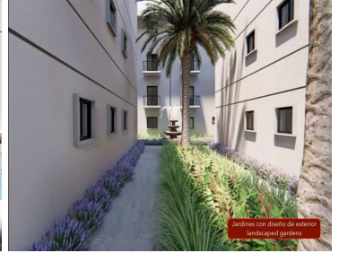
Jardines con diseño de exterior landscaped gardens