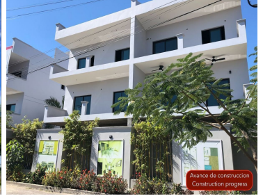
Avance de construcción Construction progress