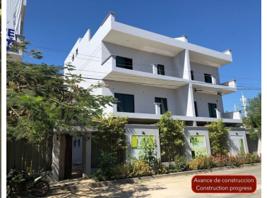
Avance de construcción Construction progress