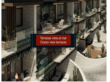
Terrazas vista al mar Ocean view terraces