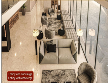
Lobby con concierge Lobby with concierge