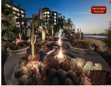
Area de juegos Fun pit area