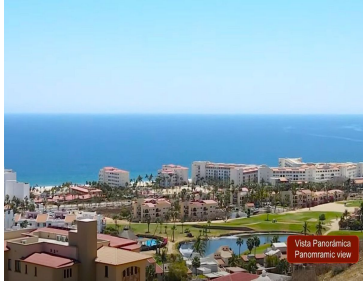
Vista Panorámica Panoramic view