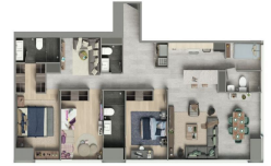
Departamento 3 Recámara 2 Baños * Family room Cocina * Estacionamiento * Family room