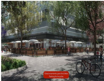
Estacionamiento para bicicletas Parking for bicycles