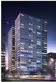
Edificio moderno con vistas panorámicas Modern building with panoramic views