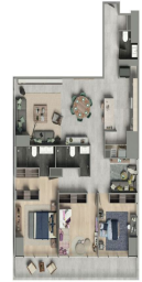
Departamento 1 Recámara 2 Baños * Family room Cocina * Estacionamiento * Terraza * Family room