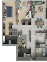
Departamento 2 Recámara 2 Baños * Family room 2 Baños * Estacionamiento * Family room con 1