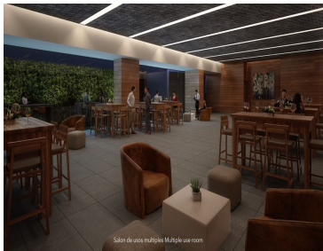
Salón de usos múltiples Multiple use room