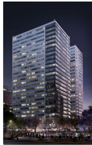
Área comercial en planta baja Commercial area in ground floor