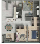
Departamento 2 Recámara 2 Baños * Family room Cocina * Estacionamiento * Family room