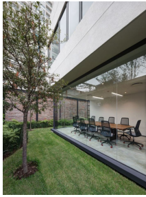
Áreas comunes con vistas a áreas verdes Common areas with green views