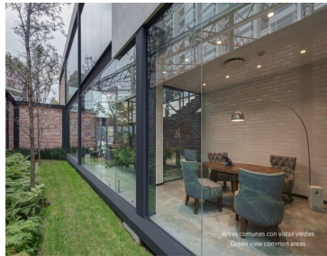
Áreas comunes con vistas verdes Areas with green views