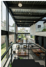
Vistas a áreas verdes y edificios Views to green areas and buildings