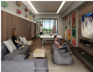
Salón de jóvenes * Teens room