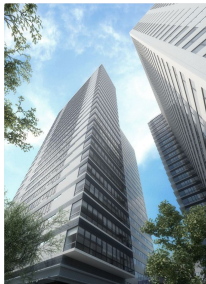
Vista inferior del edificio Lower view of the building