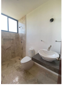
Marble y luz natural Marble and natural light