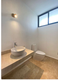
Baños con ventanas y luz natural Bathrooms with windows and natural light