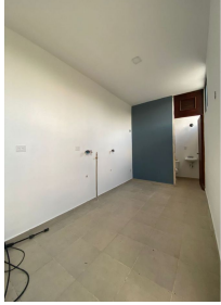
Cuanto de servicio con baño Service room with bathroom