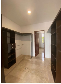
Closet de recámara principal Master bedroom-closet