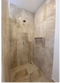
Acabado de baño Bathroom finishes