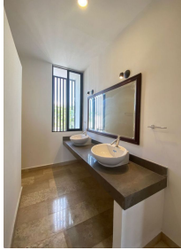
Recámara principal Baño con doble lavabo Master bedroom bathroom with double sink