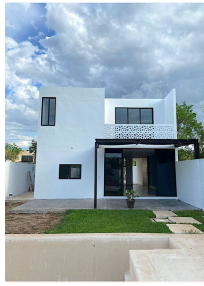
View house View from the back