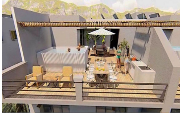
Penthouse con alberca privada Penthouse with private pool