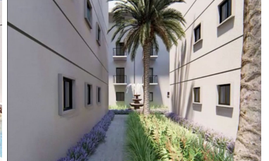
Jardines con diseño de exterior landscaped gardens