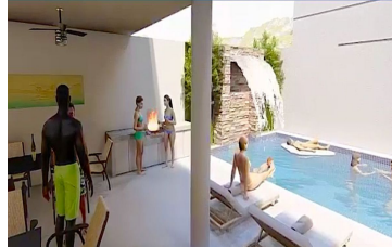
Terraza techada con alberca Covered terrace with pool