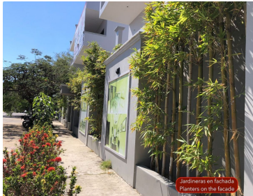
Jardines en fachada Plantes on the facade