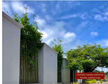
Fachada, mallas exteriores Facade, outdoor pots