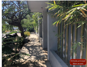
Entrada principal Main access