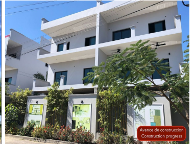
Avance de construcción Construction progress