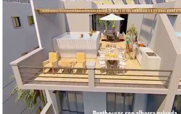
Penthouses con alberca privada Penthouses with private pool