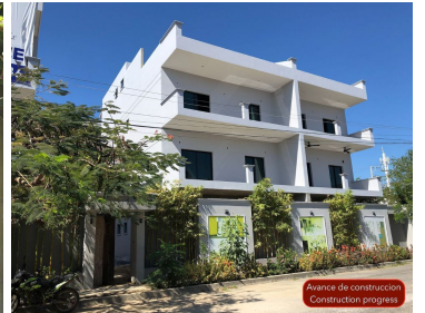
Avance de construcción Construction progress