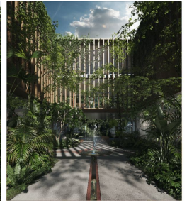
Fachada desde interior Indoor facade