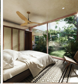
Recámara Ventada de pared completa Bedroom Full wall window