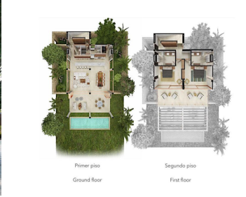
Primer piso Ground floor