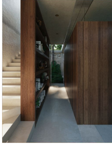
Escaleras planta baja Ground floor stairs