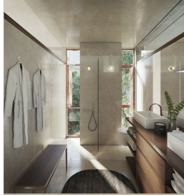
Baño luz natural Bathroom natural light