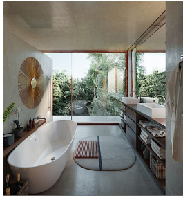
Baño principal vista verde Main bathroom green view