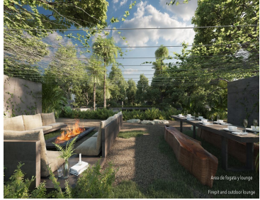
Área de fogón y lounge Firepit and outdoor lounge