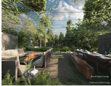
Área de fogón y lounge Firepit and outdoor lounge