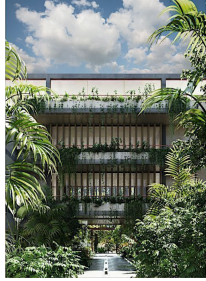
Entrada principal Main entrance