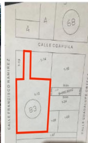
Terreno con doble frente de calle double street front land