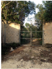
Barda perimetral Perimeter fence