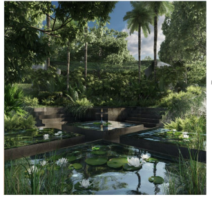
Fuente Espejos de agua Fountain Water mirrors