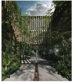
Fachada desde interior Indoor facade