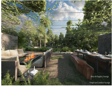
Área de fogón y lounge Firepit and outdoor lounge