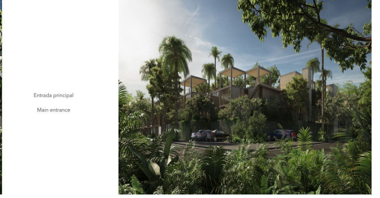
Entrada principal Main entrance