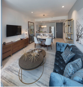
Distrik: Duren Open design