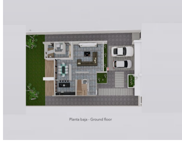
Planta baja - Ground floor