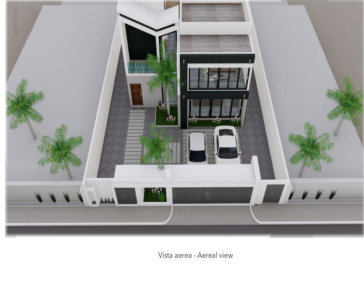
Vista aerea - Aerial view