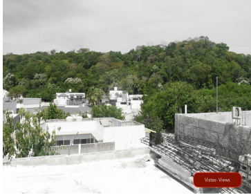
Vistas - Views