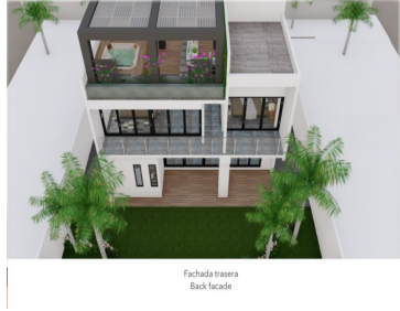
Fachada trasera - Back facade