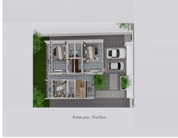
Primer piso - First floor