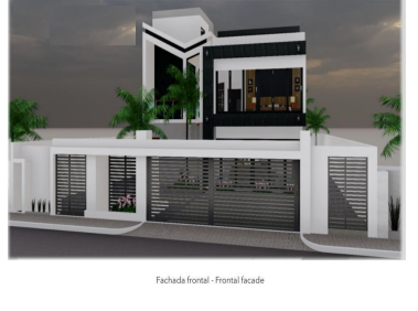
Fachada frontal - Frontal facade