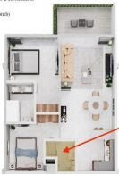
Espacio flexible Flexible space