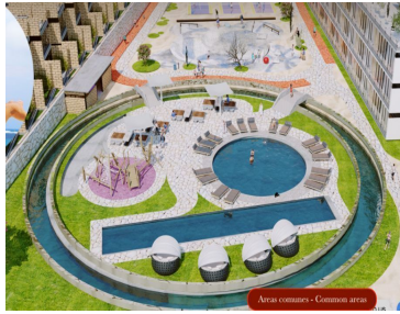
Área comunes - Common area