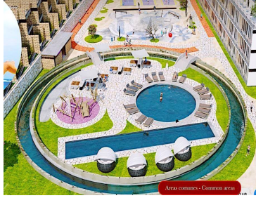
Área comunes - Common area