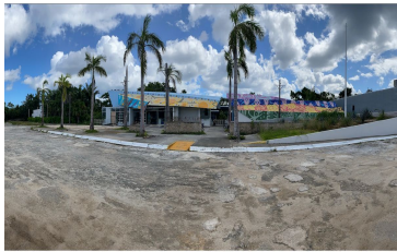
Vista frontal - front view