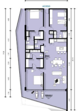
Departamento 3 Recamaras 3.5 Baños Condo 3 Bedrooms 3.5 Bathrooms