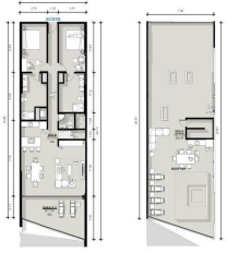
Profilouse 3 Recamaras 3.5 Baños Profilouse 3 Bedrooms 3.5 Bathrooms