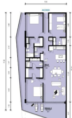
Departamento 3 Recamaras 3.5 Baños Condo 3 Bedrooms 3.5 Bathrooms