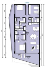
Departamento 3 Recamaras 3.5 Baños Condo 3 Bedrooms 3.5 Bathrooms