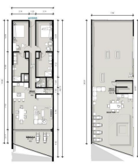
Prehouse 3 Recamaras 2.5 Baños Prehouse 3 Bedrooms 2.5 Bathrooms