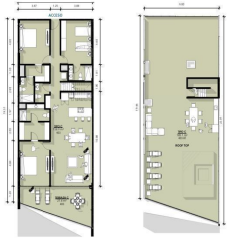
Prehouse 3 Recamaras 3.5 Baños Prehouse 3 Bedrooms 3.5 Bathrooms