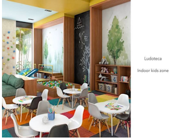
Ludoteca Indoor kids zone