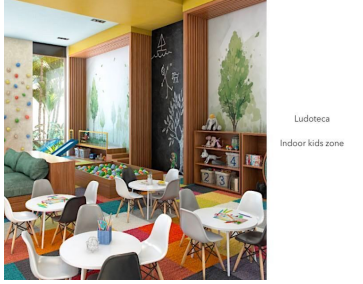
Ludoteca Indoor kids zone