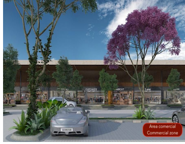
Area comercial Commercial zone