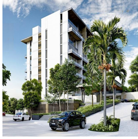
Edificio con áreas verdes Building with green areas