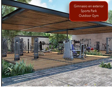
Gimnasio en exterior Sports Park Outdoor Gym