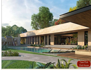
Casa Club Club House