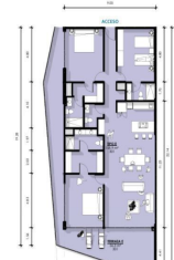
Departamento 3 Recamaras 3.5 Baños Condo 3 Bedrooms 3 Bathrooms