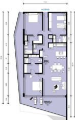
Departamento 3 Recamaras 3.5 Baños Condo 3 Bedrooms 3.5 Bathrooms