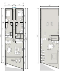
Penthouse 2 Recamaras 2.5 Baños Penthouse 2 Bedrooms 2.5 Bathrooms