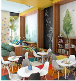
Ludoteca Indoor kids zone