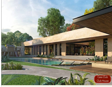
Casa Club Club House