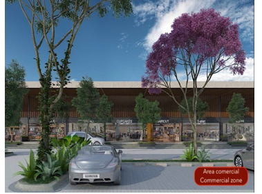
Area comercial Commercial zone