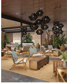
Area lounge Casa club Club house lounge area