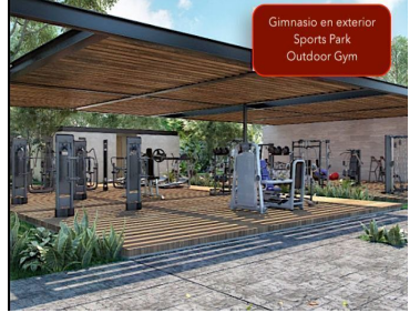
Gimnasio en exterior Sports Park Outdoor Gym