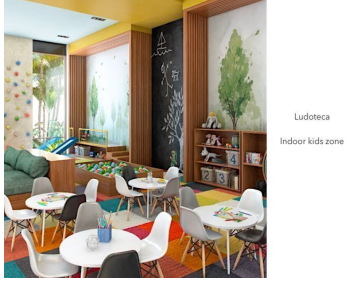
Ludoteca Indoor kids zone