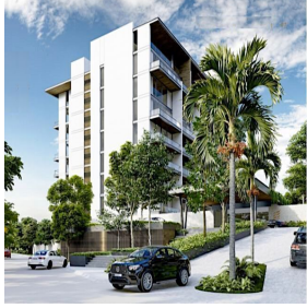
Edificio con áreas verdes Building with green areas